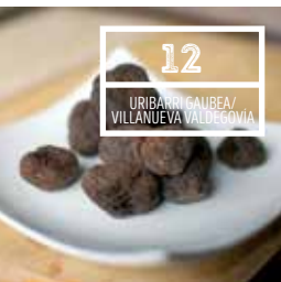
12 URIBARRI GAUBEA/ VILLANUEVA VALDEGOVÍA

Desde la Plaza España hacia la parroquia de San Pedro con los gigantes y cabezudos acompañados de txistularis, gaiteros y trikitalaris. Reparto de chocolate, 'Dantza Plazan', rifa en el salón de Plenos de la Casa Consistorial y toros de fuego completan el programa.